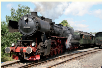
52 4544 Bj. 1944 1620 PS 1'Eh2