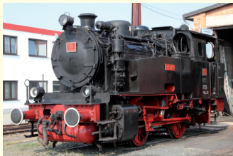
HC 5 Bj. 1952 350 PS Bn2t