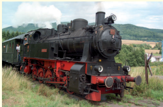
HC 206 Bj. 1941 750 PS Eh2t