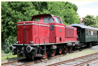
V 15 Bj. 1958 650 PS D-dh