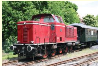
V 15 Bj. 1958 650 PS D-dh