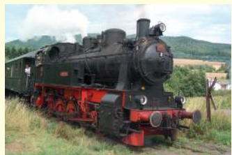
HC 206 Bj. 1941 750 PS Eh2t