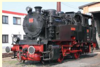
HC 5 Bj. 1952 350 PS Bn2t