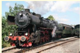
52 4544 Bj. 1944 1620 PS 1'Eh2